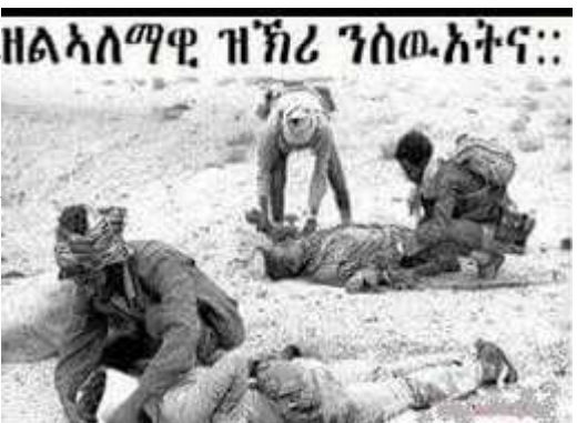
ዘልኣለማዊ ዝኸሪ ንሰውኣትና።

ቀዳማይ መጥቃዕቲ ግምባር ሰሜናዊ ምብራቕ ኣብ ዕለት 19/02/1984፡ ነቲ ብውቃው እዝ ዝፍለጥ ኣብ'ቲ ግምባር ዓሪዱ ዝነበረ ሓይሊ ጸላኢ